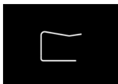
SP C11 880